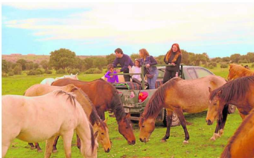
Safari Ibérico en El Cubillo, en el que los visitantes observan una manada de caballos