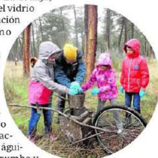
Taller sobre el oficio de los resineros en Coca

se puede participar en visitas teatralizadas que permiten viajar al pasado.