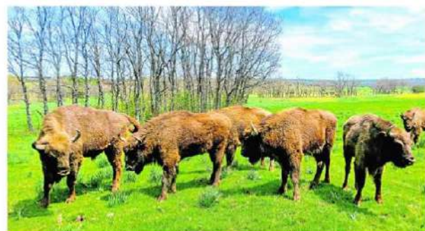
Bisontes en una granja en semilibertad

Romanos, musulmanes, visigodos, reyes, nobles y hasta el impresor más importante de España (aquel que, con acento alemán y por orden del obispo, gestó en Aguilafuente el primer libro de todo el país), han habitado en la provincia de Segovia. Muchos son los personajes, históricos y anónimos, que se pueden descubrir si se señala uno de sus pueblos al azar sobre el mapa, y aún mayor será el número de paisajes disponibles para admirar a caballo, desde una piragua, desde una bicicleta o desde las alturas en globo. También de liana en liana, si os regaláis unas horas en el parque multiaventuras Pinocio. Y es que, en la provincia de Segovia, un viaje con los tuyos puede convertirse en un completo álbum de fotos. Más información en: www.prodestursegovia.es